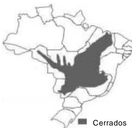
Região dos cerrados no Brasil